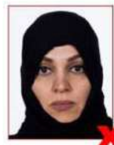
Eyes/edges of face obscured Yeux/bords du visage cachés