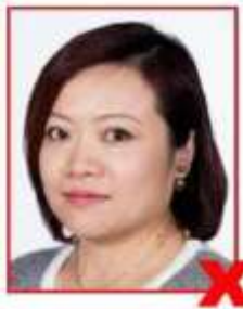
Side on to camera Photo de profil