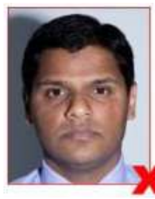
Shadows on image and background Ombres visibles sur image et arrière-plan