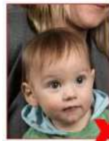
Parent visible Parent visible