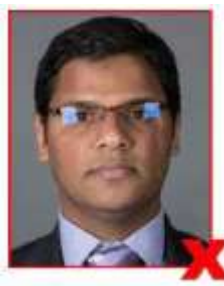
No glasses Pas de lunettes