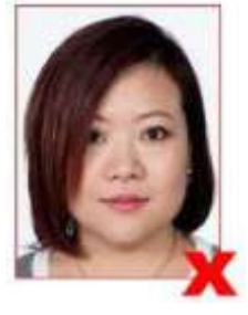
Hair obscuring face Cheveux cachent une partie du visage