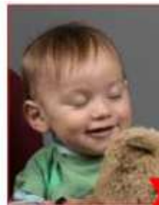
Eyes not open / toy visible Yeux fermés / jouet visible