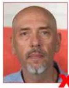
Background not plain Arrière-plan non-uni