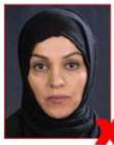
Background too dark Arrière-plan trop sombre