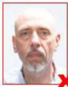
Insufficient contrast Contraste insuffisant